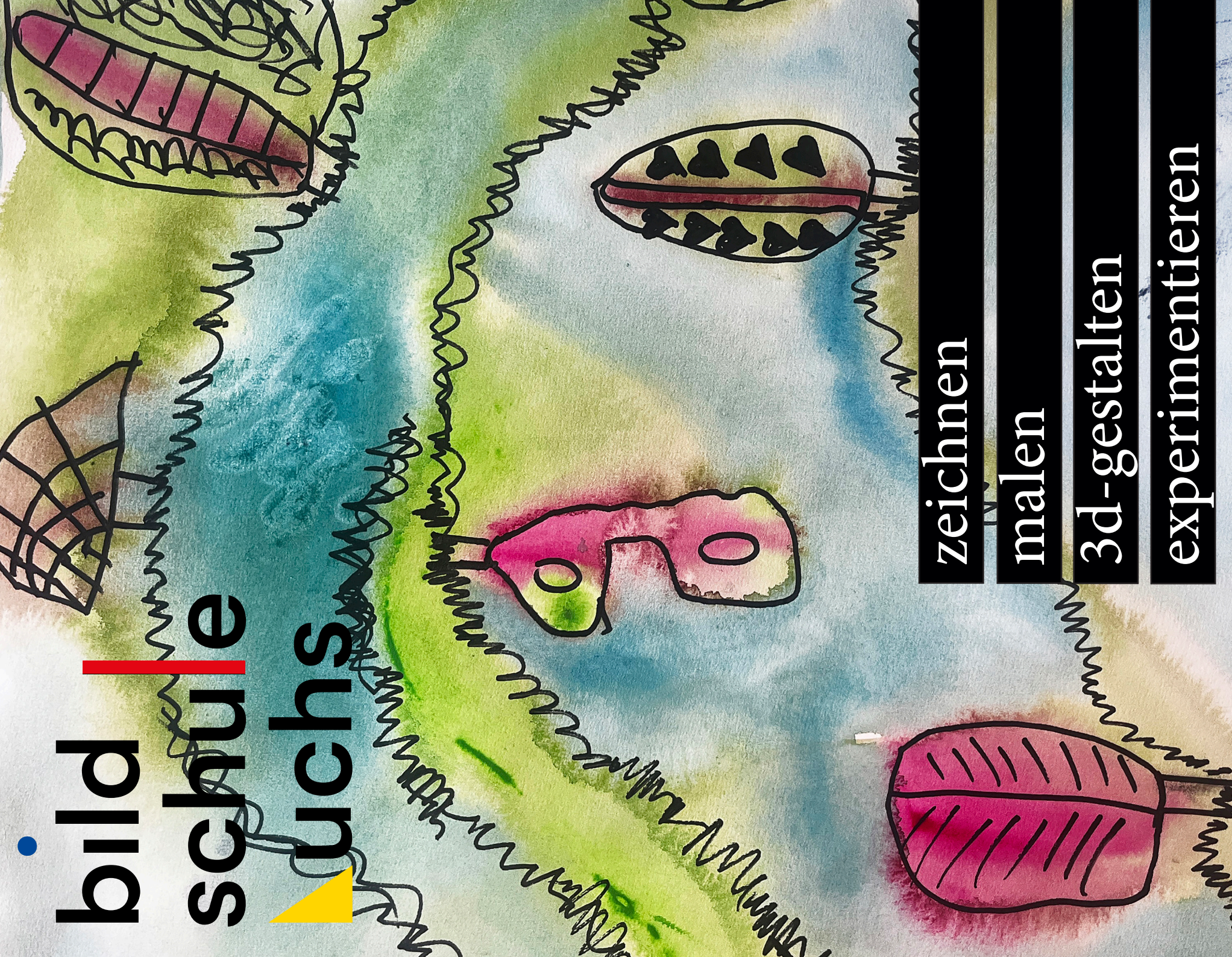
bild schule suchs